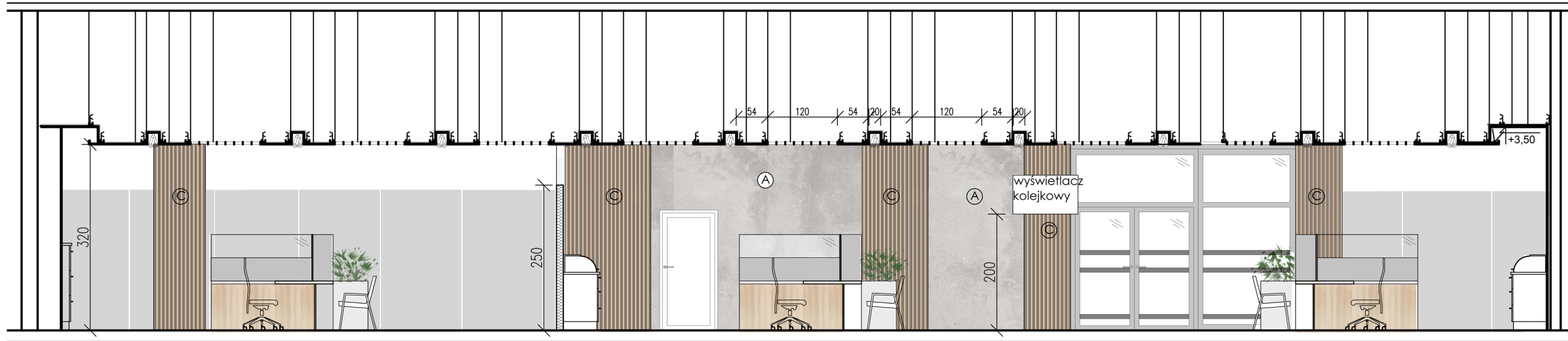
widok 3(w kolorze)